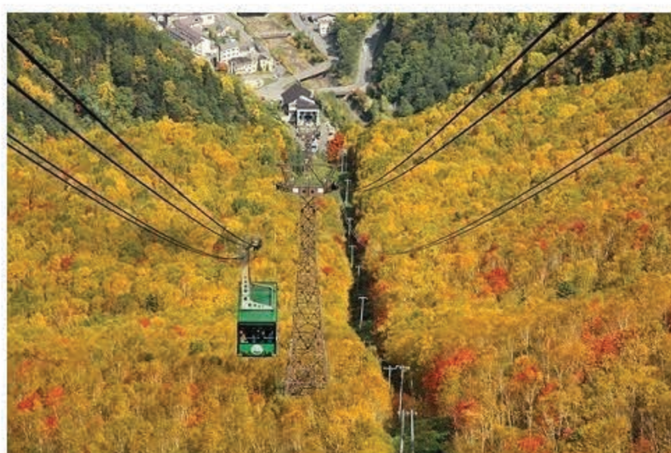
黑岳空中纜車 (僅供參考)