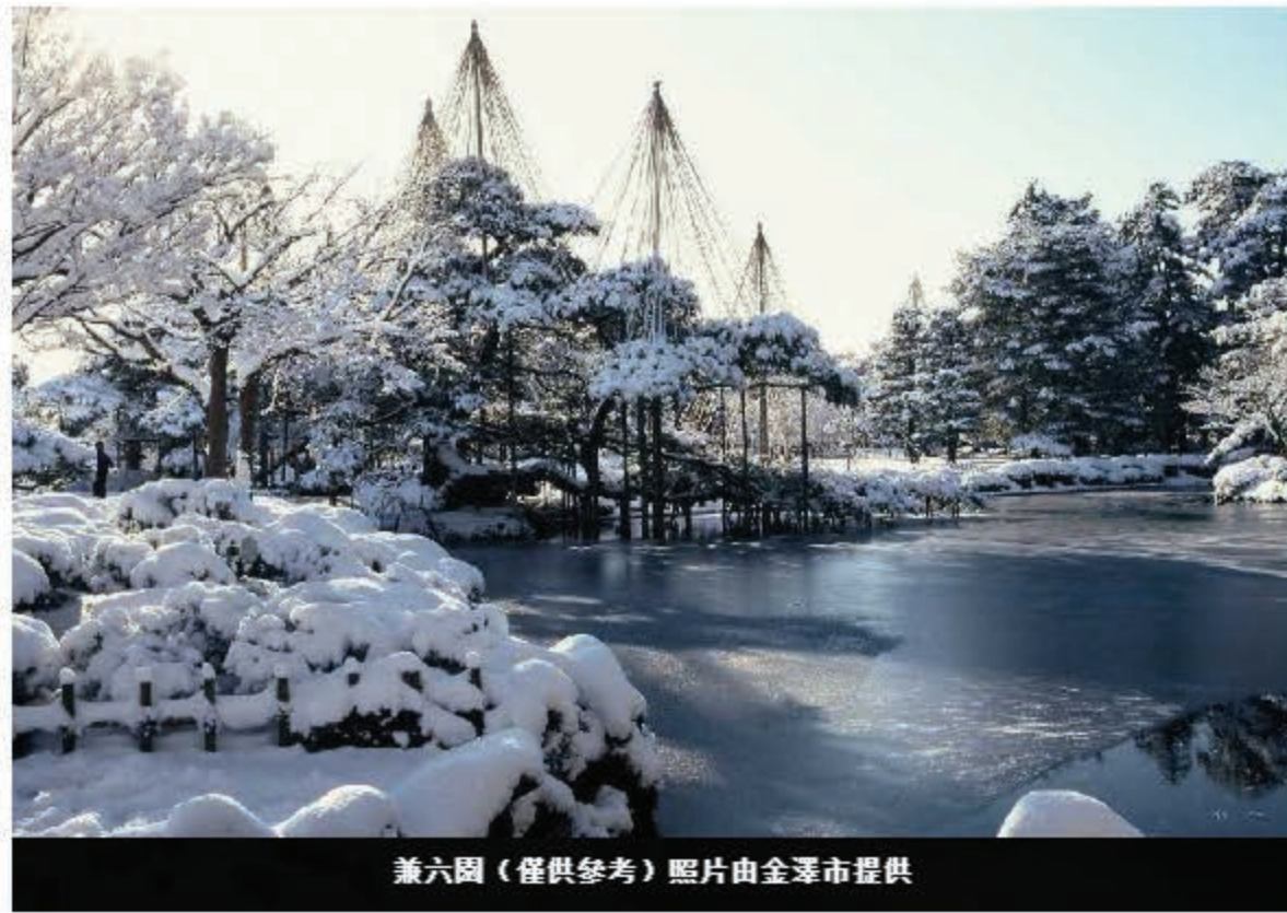
兼六園 (僅供參考)