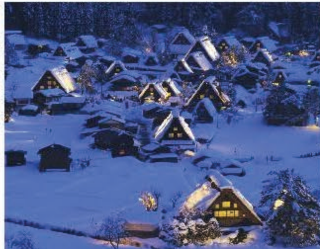
白川鄉點燈 (僅供參考/冬・1月)