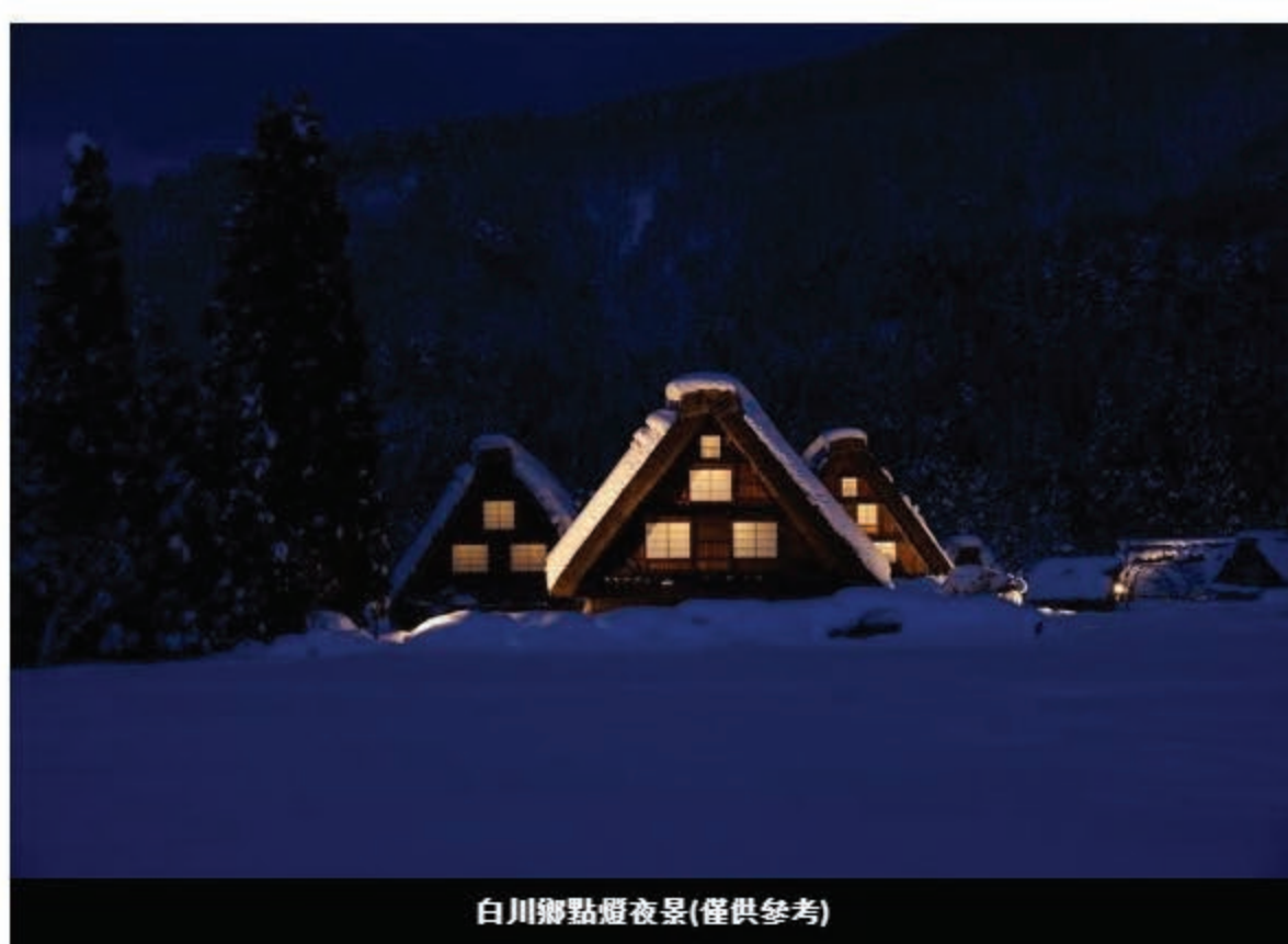
白川鄉點燈夜景(僅供參考)